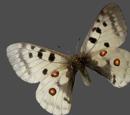
Apollofalter in der NIZA Schmetterlingssammlung