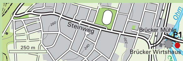
P1 Brücker Mühle (im Gelände hinter der Mühle)