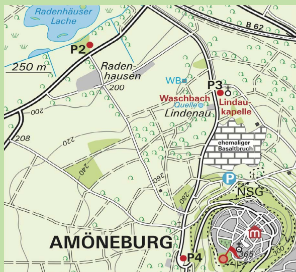
P2 Radenhäuser Lache (gegenüber Hofgut Radenhausen an der L3088)